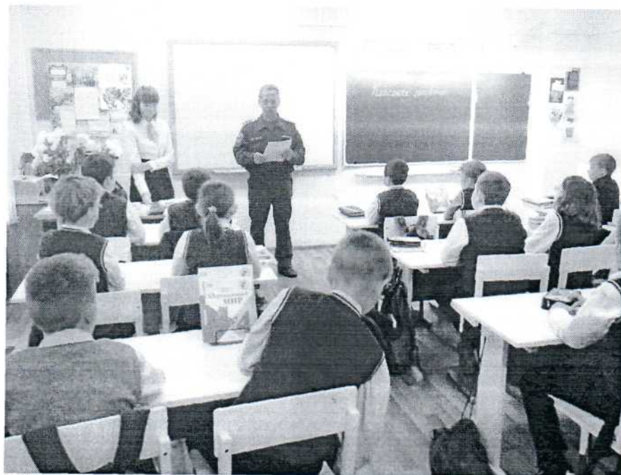
«Наша служба и опасна и трудна» встреча с представителем городской службы МЧС