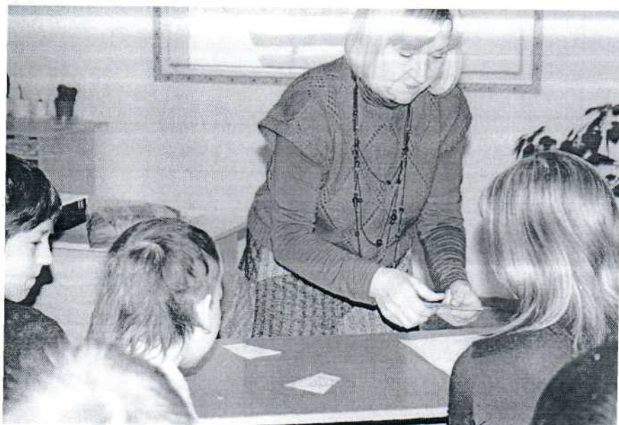
Практическое занятие «Умей защитить себя»